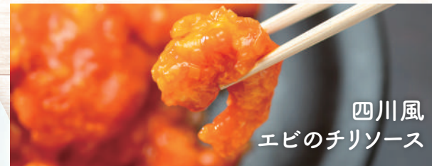
四川風 エビのチリソース