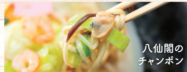
八仙閣の チャンポン