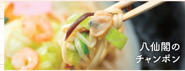
八仙閣の チャンポン

八仙閣オリジナルの中太麺に焼き目をつけ、丁寧に仕込んだ鶏ガラスープと野菜の旨味をしっかり染み込ませました。(1食:300g)