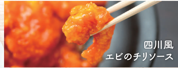
四川風 エビのチリソース